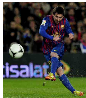
L'Argentin Lionel Messi, artisan du triomphe du Barça.